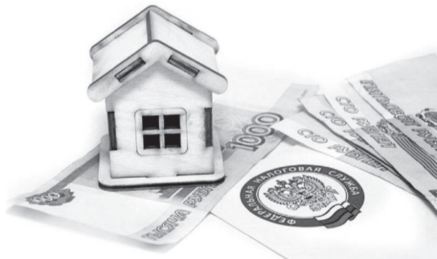
До 1 декабря жители Приангарья должны уплатить имущественные налоги.

на имущество в этом году начислено на четверть больше, чем в прошлом. Выросла сумма и транспортного налога (на 131 млн рублей), что связано с увеличением количества самих автомобилей в собственности у граждан. А земельный – сократился на 20 млн рублей.