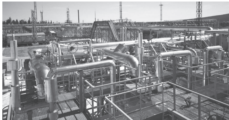
На Ковыкту возлагают большие надежды по газификации городов и посёлков области.

— Запуск Ковыктинского месторождения имеет огромное значение для всей страны и, в частности, для Иркутской области. Для нашего региона реализация этого проекта носит практическое значение. Это запуск газовых котельных, перевод транспорта на газ. Это долгожданные проекты, мы рады, что они будут реализованы, и со своей стороны прилагаем к этому массу усилий, — отметил Игорь Кобзев.