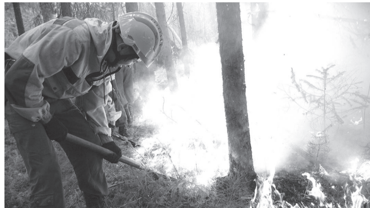
В этом году пожаров было больше, но площадь их меньше, чем годом ранее.

Напомним: в этом году лесных пожаров на территории области зарегистрировано несколько больше, чем в прошлом году, при этом площадь горения сократилась с 461,6 тыс. гектаров до 194,2 тыс. Это говорит о значительном повышении оперативности тушения. 83,5% лесных пожаров ликвидировали в день обнаружения и на следующий день. В прошлом году этот показатель был равен 66,8%.