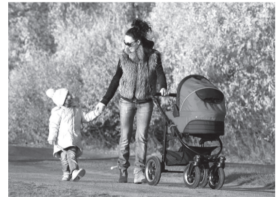
Новое универсальное пособие для семей объединит семь различных мер соцподдержки.