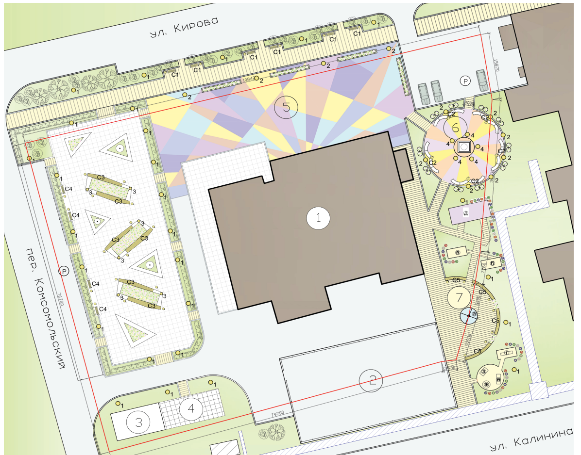
Рис. 1. Проект благоустройства территории, прилегающей к РКДЦ «Магистраль»