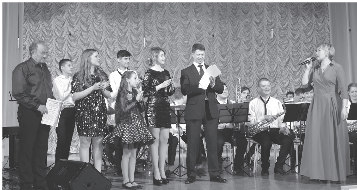
Мы не прощаемся с гостями города, а говорим «до свидания»