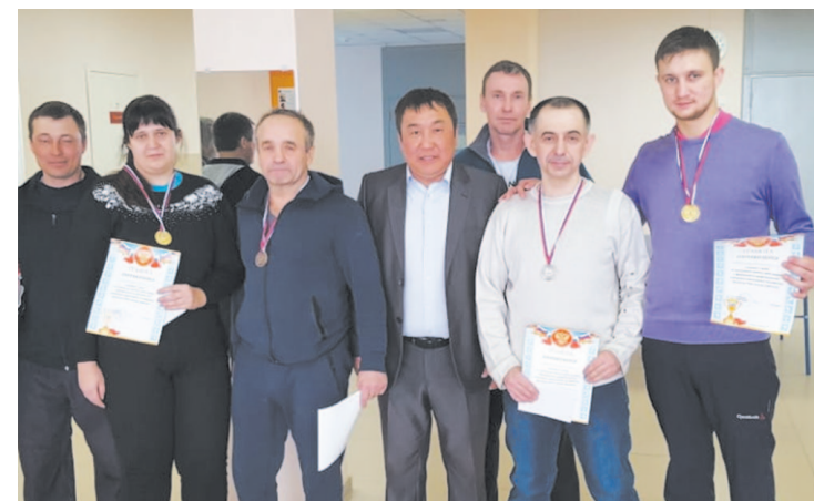
Устькютяне участвовали в соревнованиях по теннису в г. Северобайкальск

Усть-кутские лыжники показали отличный результат на этих соревнованиях и очередной раз доказали, что спортивные традиции в нашем городе сильны.