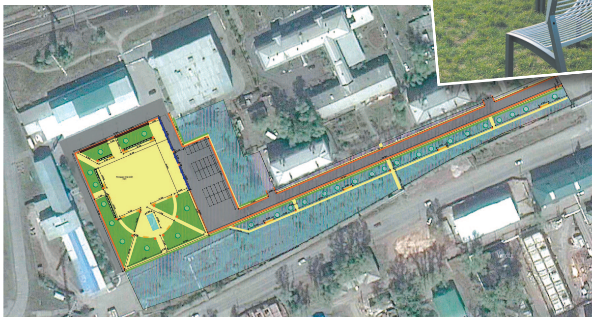
Рис. 2. Проект благоустройства сквера у стадиона «Водник»

Любовь Арбатская, информация и иллюстрации с официального сайта администрации МО «г. Усть-Кут».