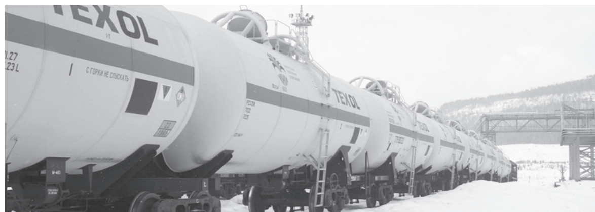
Новые цистерны для перевозки СУГ отвечают всем требованиям безопасности и обладают серьезными эксплуатационными преимуществами

Впоследствии планируется расширение производственной площадки и увеличение спектра выпускаемой продукции, в том числе реализация проекта по переработке метана, что позволит властям региона инициировать газификацию Усть-Кута.