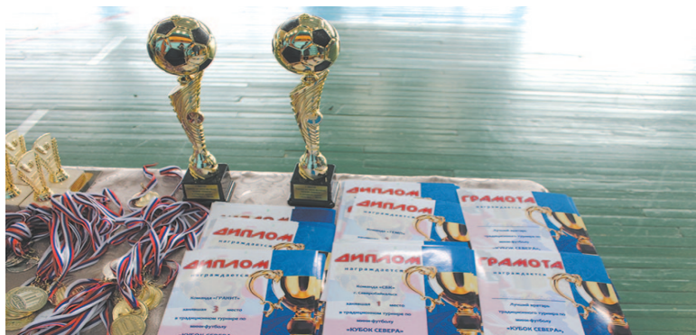
«Кубок Севера-2019» на призы главы города

– Для меня было важно сохранить добрые традиции такого массового вида спорта как футбол. Будучи директором компании, я подхватил эту инициативу и создал свою команду.