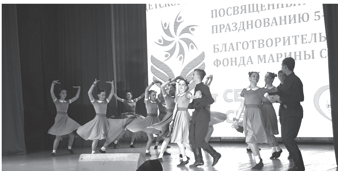
27 марта сразу на двух площадках – в ДК «Речники» и РКДЦ «Магистраль» – прошли отборочные этапы творческого конкурса «От сердца к сердцу», организованного благотворительным фондом Марины Седых в честь пятилетнего юбилея. Победители отборочного этапа получили путёвку на финальный гала-концерт.