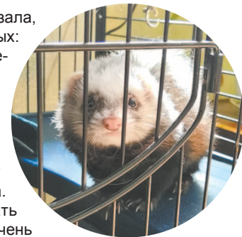
Хорек – очень активный и ласковый зверек

Живой уголок – излюбленное место школьников, которые с удовольствием наблюдают за жизнью животных. Приходите и убедитесь в этом сами!