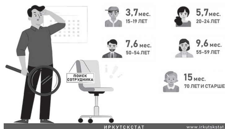
ПРОДОЛЖИТЕЛЬНОСТЬ ПОИСКА РАБОТЫ В ПРИАНГАРЬЕ ЛИЦАМИ РАЗНОГО ВОЗРАСТА (В 2020г.: МЕСЯЦЕВ)

В 2020 году в целом по Иркутской области уровень безработицы составил 7,7 процента, а без учащихся и пенсионеров – 6,8 процента. В 2020 году по сравнению с 2019-м число обратившихся в государственную службу занятости выросло в 1,7 раза.