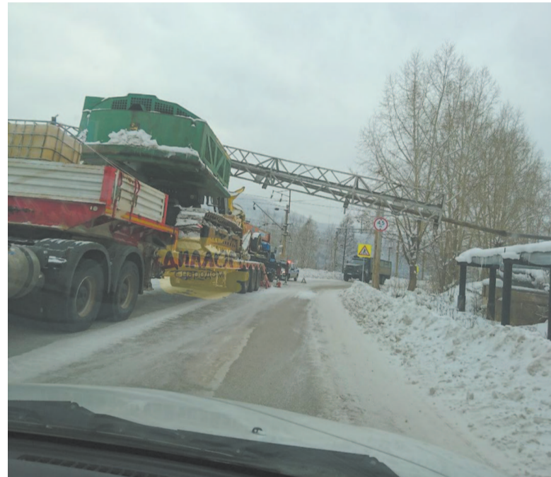
Фото очевидцев происшествия

ДТП произошло в воскресенье, 30 января днём. Водитель траля, перевозивший крупногабаритную спецтехнику, не рассчитал высоту груза и повредил трубу водоотведения. На место оперативно выехали сотрудники ГИБДД, коммунальщики и представители городской администрации. Руководство компании, которой принадлежал большегруз, оперативно направило специалистов для устранения последствий аварии. Целостность системы водоотведения была оперативно восстановлена, на жизнедеятельности микрорайона это никак не отразилось.