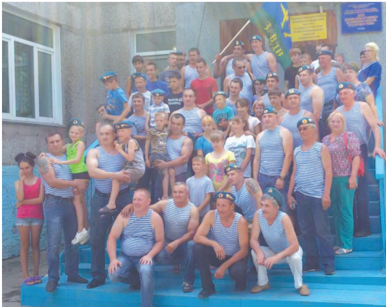
Десантники нашего города взяли шефство над воспитанниками Центра помощи семье и детям, оставшимся без попечения родителей.