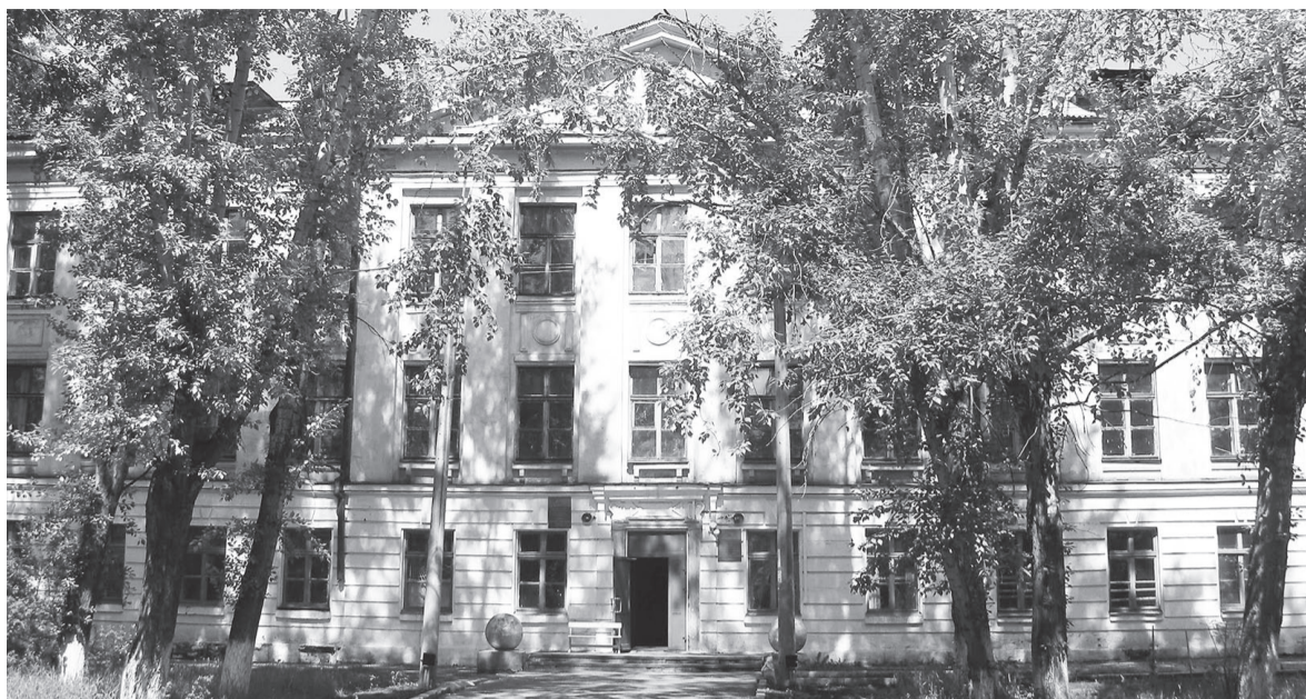
В ноябре средняя школа № 2 г. Усть-Кута отмечает своё 85-летие.