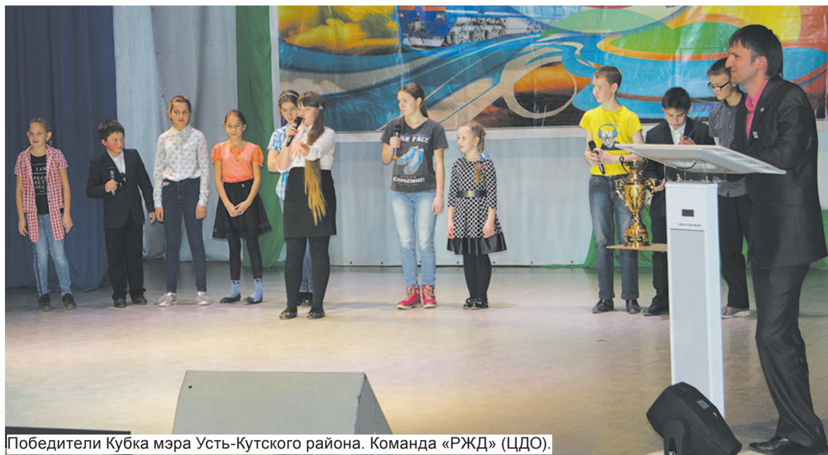
Победители Кубка мэра Усть-Кутского района. Команда «РЖД» (ЦДО).

Подготовила Анастасия Чепелева.