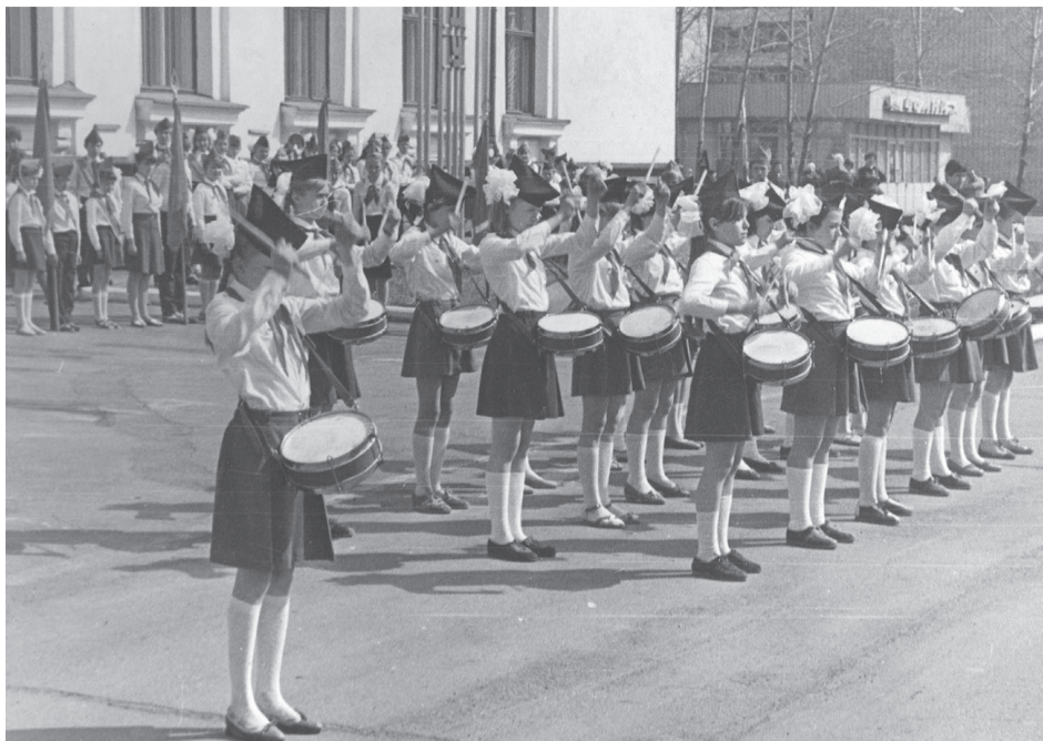
Юные барабанщики школы № 4 встречают Первомай.