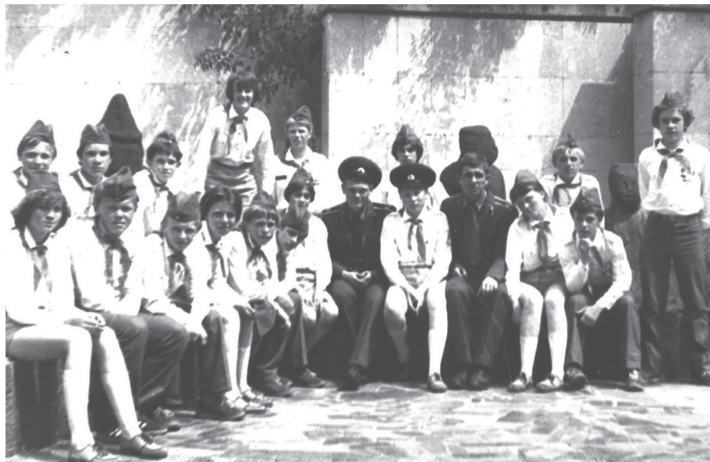
В 1983 году «зарничники» четвертой школы побывали в г. Днепропетровске на X Всесоюзном слёте победителей пионерской игры «Зарница».