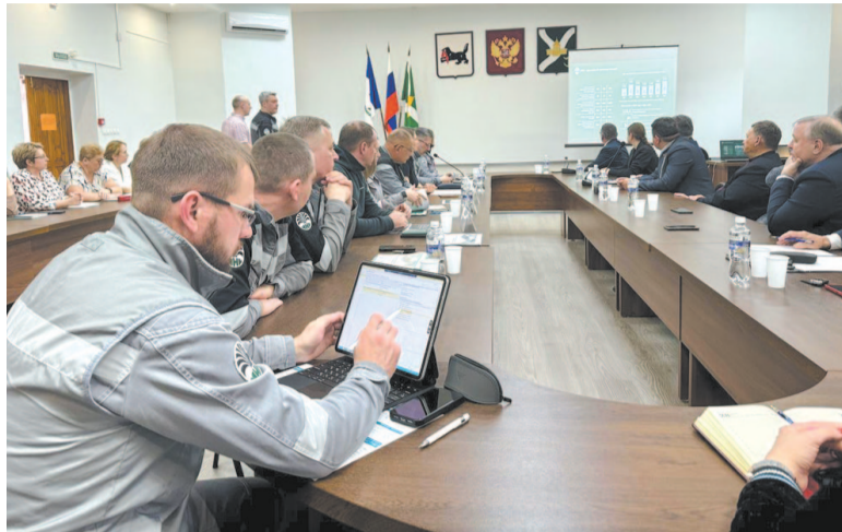
Отчёт ИНК о деятельности за 2023 год на территории района.

техникума компания запустила корпоративную группу по направлению КИПиА. После получения дипломов выпускники будут трудоустроены в компанию. Также для жителей Усть-Кута действует программа «ПрофСтарт»: предприятие берет на себя обязательства по подготовке и трудоустройству соискателей без высшего образования. На сегодня подано 75 анкет, из них 25 – на этапе трудоустройства.