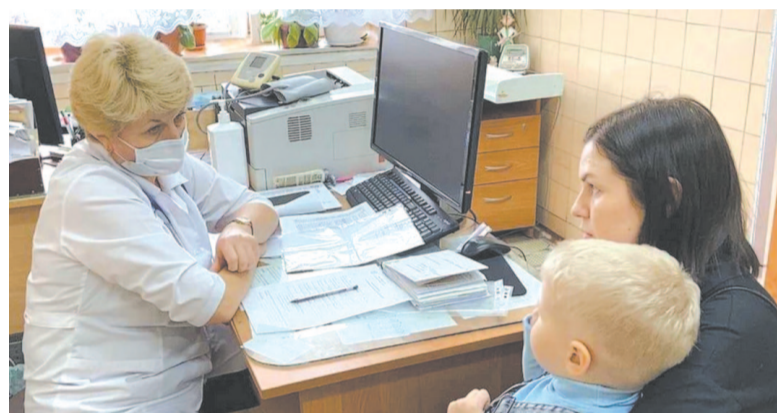
Фонд Марины Седых организует выезды врачей в Усть-Кутский район.

Активную поддержку компании на территории оказывает фонд Марины Седых. Ежегодно реализуется помощь малоимущим жителям, выездные приемы врачей из Иркутска, акции для детей. В этом году Фонд также разработал программу по реабилитации для ветеранов БАМа. Более 100 человек проходят санитарио-курортное лечение в Иркутске за счет организации.