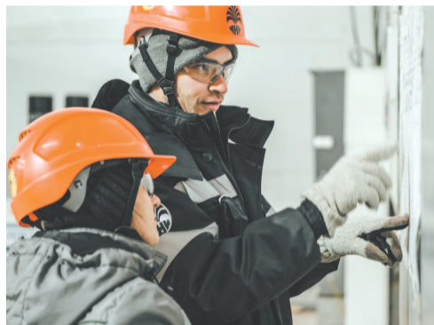
Около 900 местных жителей работает на объектах ИНК.

ИНК является привлекательным работодателем среди местных жителей. Сегодня на объектах компании работают около 900 жителей района. Компания реализует ряд