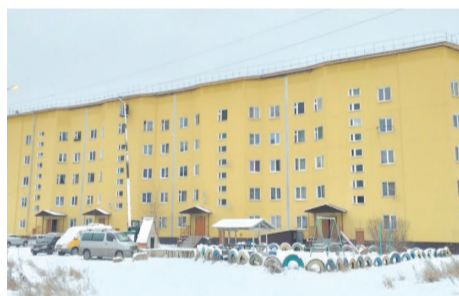
ИНК провела капремонт дома в микрорайоне Мостоотряд.

Кроме этого, ИНК реализует программу социальных инвестиций, направленную на улучшение качества жизни в районе. В 2023 году компания провела ремонт многоквартирного дома, разработала проект центральной набережной и проектно-сметную документацию для ремонта техникума.