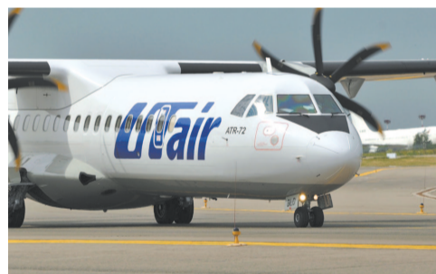
С апреля 2024 года запущен авиарейс на новых самолетах.

программ, направленных на подготовку кадров еще со школы.