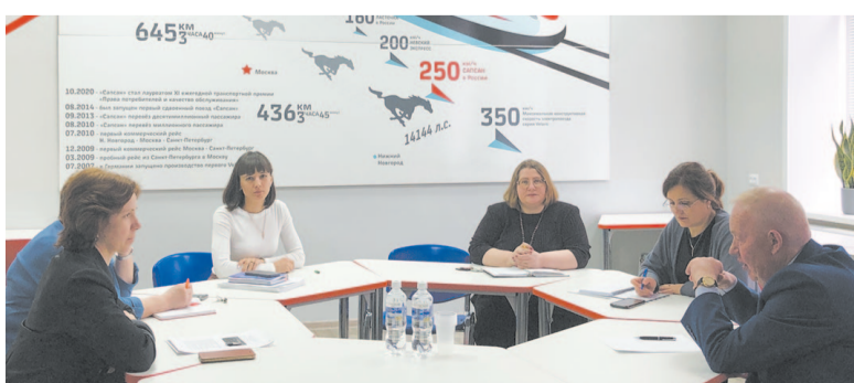
Усть-Кутский лицей является опорной школой РЖД.

руководством на территории Усть-Кутского муниципального образования, так как лицей является опорной