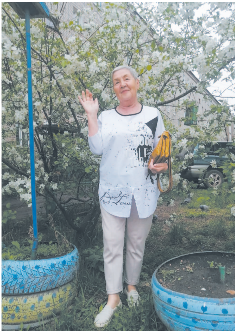
Дача – одно из любимых мест отдыха.

Беседовал Николай Чупров