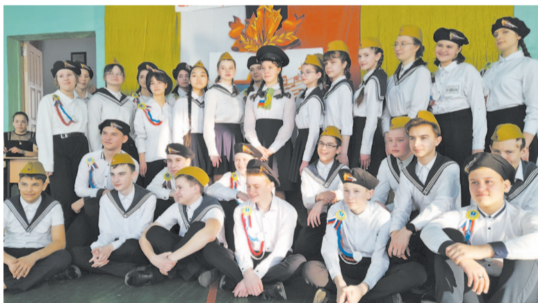
Все участники мероприятия хорошо подготовились к смотру.

нение, выполняли все задания уверенно и чётко. Компетентное жюри оценивало