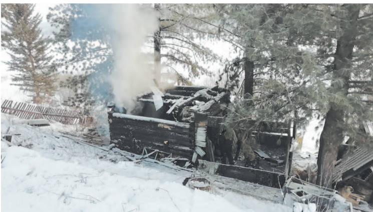
При разборе завала было обнаружено тело мужчины.

Наиболее вероятная причина этого пожара – неосторожное обращение с огнём. По факту пожара проводится проверка.