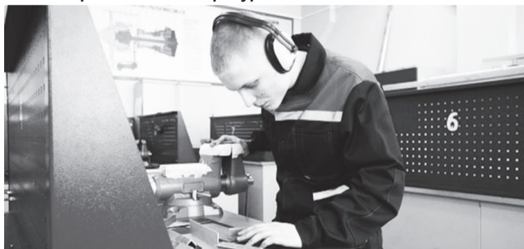
Иркутская область участвует в госпрограмме «Профессионалитет», которая нацелена на трудоустройство обучающихся.

В 2023 году в Иркутской области стартует процесс модернизации системы среднего профессионального образования. В частности, запускается перевооружение материально-технических образовательных ресурсов.