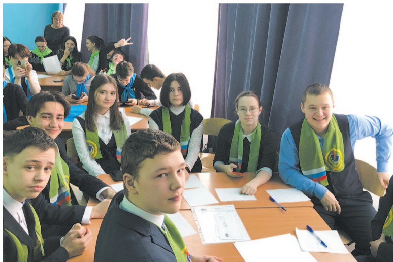
Участники квеста проявили эрудицию и смекалку.

Этот день выдался в лицее по-настоящему горячим. Все прибывающие на мероприятие очень волновались. И неудивительно, ведь игра была направлена на развитие навыков исследовательского мышления, лидерских качеств, коммуникативности, на тренировку навыков поиска информации с применением цифровых технологий, умения работать в команде.