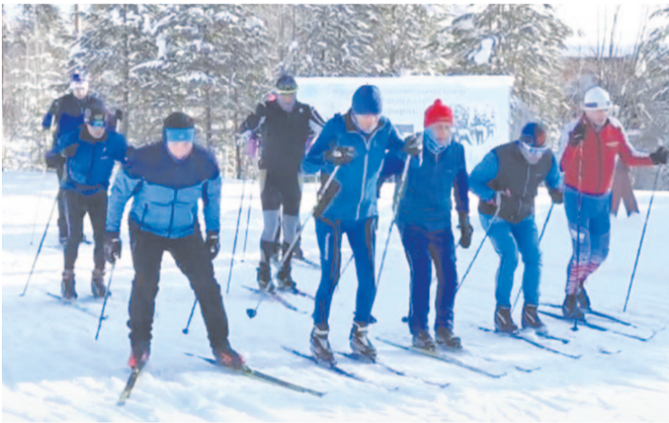
Для лыжников каждый ясный прохладный день в радость.

Завершили цикл мероприятий в тире спортивно-оздоровительного центра «Нефтяник», где прошли ежегодные соревнования по стрельбе.