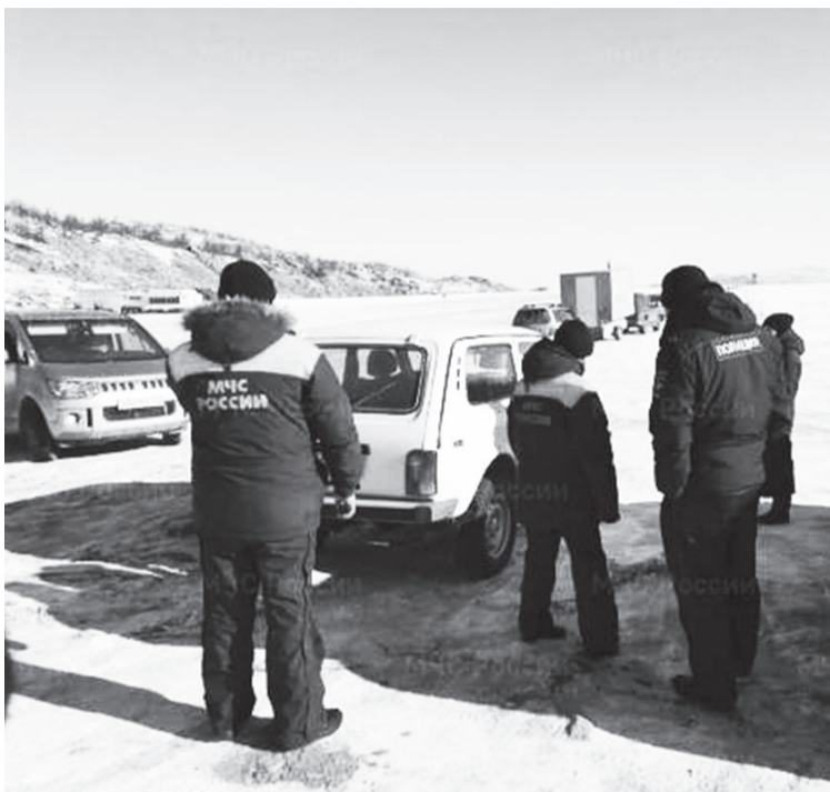
К любому походу нужно готовиться серьёзно. В том числе зарегистрировать маршрут в МЧС.