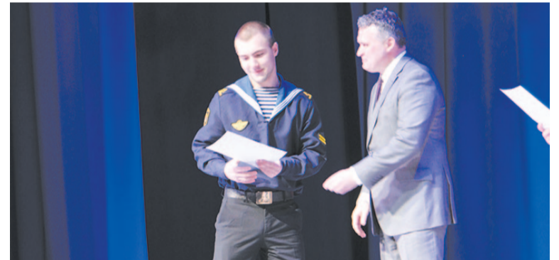
Среди волонтеров немало студентов УИВТ, ИГТК и УПТК.

Руководит организацией помощи муниципальный штаб, в который входят руководство города и района, члены общественной организации «Контингент» и представители различных структур.