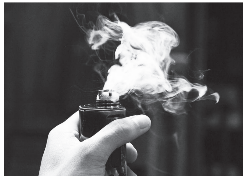
Последствия курения вейпов ещё не изучены до конца.