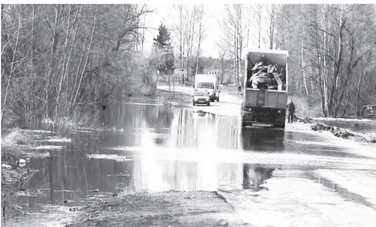
В 2022 году правительство РФ выделило на восстановление дорог после разлива рек два миллиарда рублей.

От состояния магистралей зависит развитие и социальной, и экономической составляющих. Средства из федерального бюджета направят восьми регионам России. Это Крым, Тыва, Амурская, Иркутская и Омская области, Забайкальский и Хабаровский края, а также Еврейская автономная область. В 2022 году на восстановление дорог после паводков властями также было направлено два миллиарда рублей.