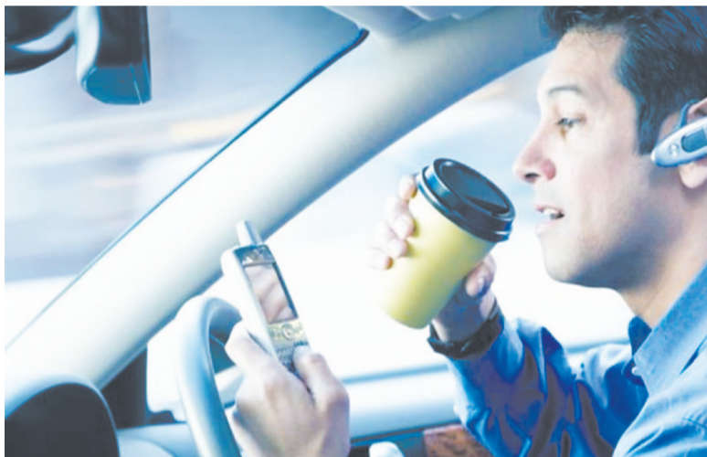
За рулём нельзя отвлекаться.

По информации МО МВД России «Усть-Кутский»