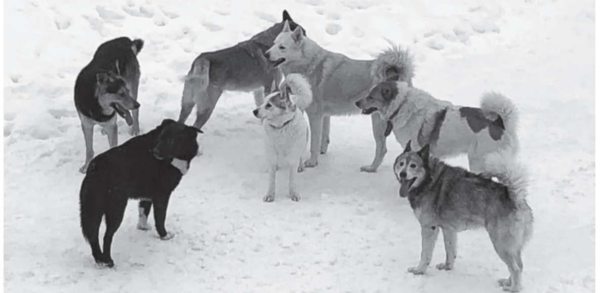
Собаки на самовыгуле зачастую более агрессивны, чем их бездомные сородичи.