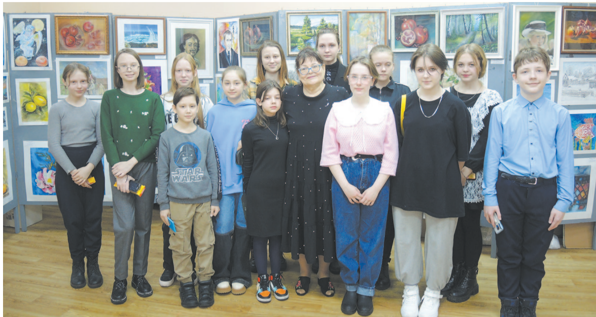
Многие выпускники пошли по стопам педагога.

Говорить об этом человеке можно бесконечно. За годы педагогической деятельности она выпустила не одно поколение учеников, которые стали профессионалами в разных специальностях: дизайнеры, педа-