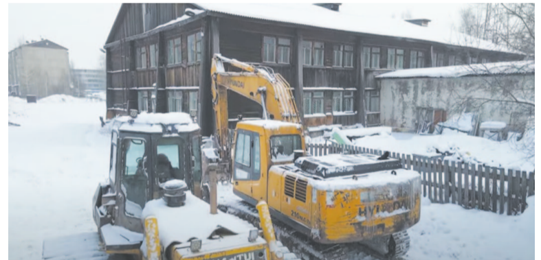
Демонтаж школы № 7 начался.

В таком режиме школьники проведут примерно полтора учебных года.