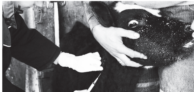
Прививки от сибирской язвы получают около 400 тыс. сельскохозяйственных животных.

профилактике болезней животных и борьбе с этими болезнями. Иммунизацию от сибирской язвы