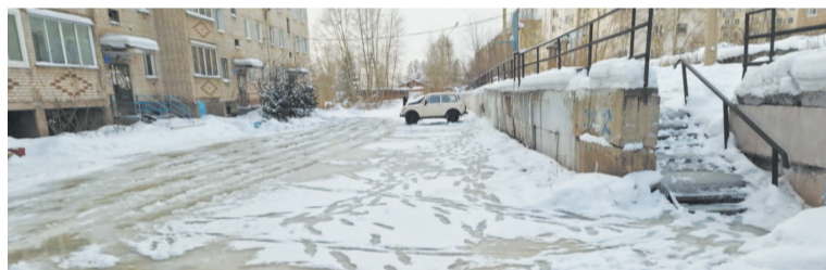
Дворы покрываются сплошной коркой льда.