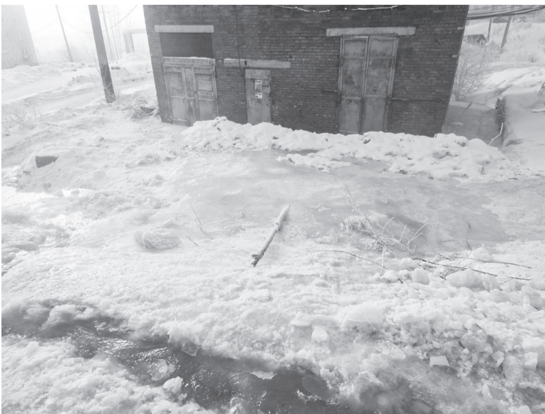
Разлившийся ручей доставляет немало проблем жителям микрорайона Речники-2.

Подготовил Николай Чупров