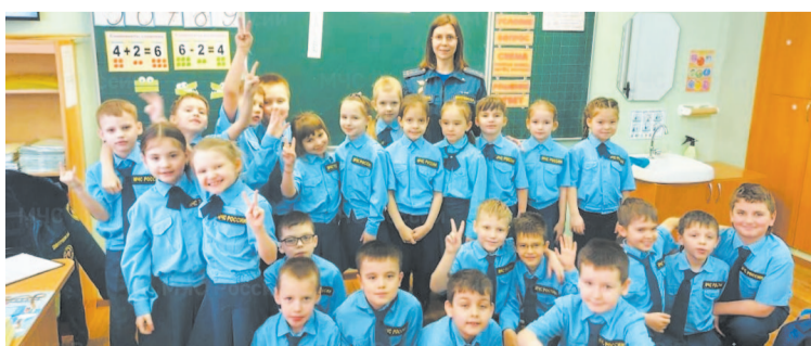
Занятия по основам пожарной безопасности проводят в школах Приангарья.

Для того чтобы проинструктировать о мерах безопасности взрослых, сотрудники МЧС России организуют подворовые обходы населения. В профилактических мероприятиях в населенных пунктах ежедневно задействовано более 2 тысяч человек. Обследуются места проживания многодетных семей, находящихся в социально опасном положении. Межведомственными группами проверяются условия проживания детей, даются рекомендации по соблюдению мер пожарной безопасности в жилье. Основное правило для взрослых – не оставлять малолетних детей без присмотра!