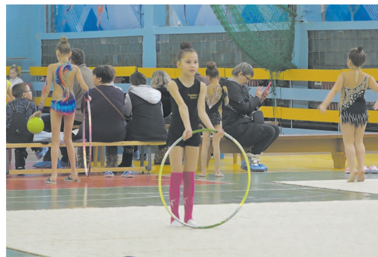
Победители поедут на областные соревнования.