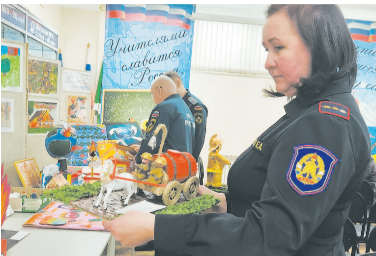
Благодаря конкурсу дети вспомнили правила поведения при пожаре.