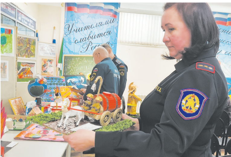
Благодаря конкурсу дети вспомнили правила поведения при пожаре.