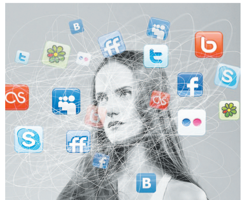
В соцсетях легко «потеряться».

Рыхальская Т.А. ленский линейный отдел полиции