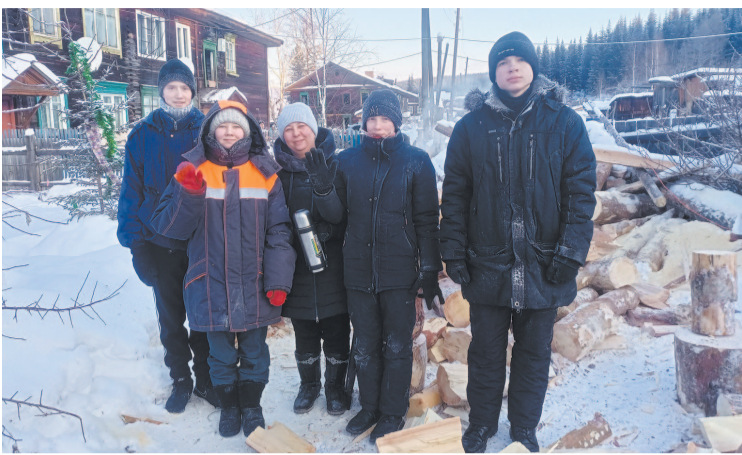
Школьники и студенты приняли участие в акции «Подари тепло».