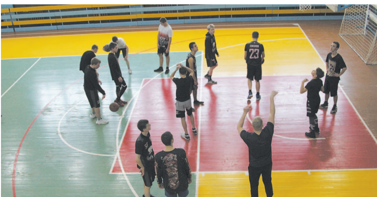
Перед игрой нужно как следует размяться.