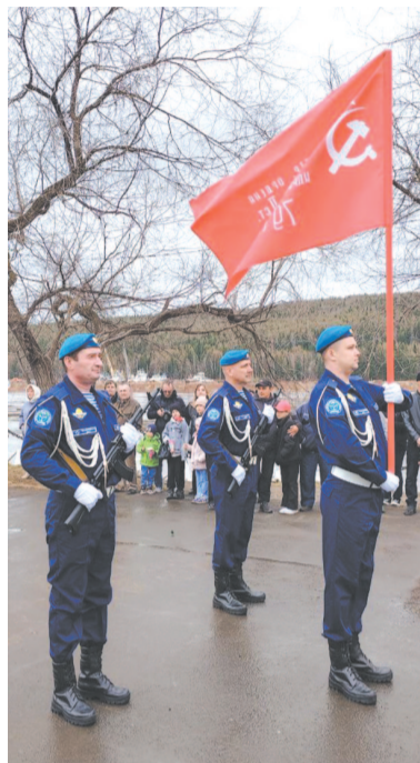
Вынос знамени союзом десантников.

А ещё посетители могут посмотреть, поддержать в руках и даже примерить снаряжение десантника, но и это ещё далеко не всё. С каждым годом организаторы пополняют коллекцию новыми экспонатами. Стоит сказать, что такая выставка проводилась в городах Киренске и Железногорске-Илимском.