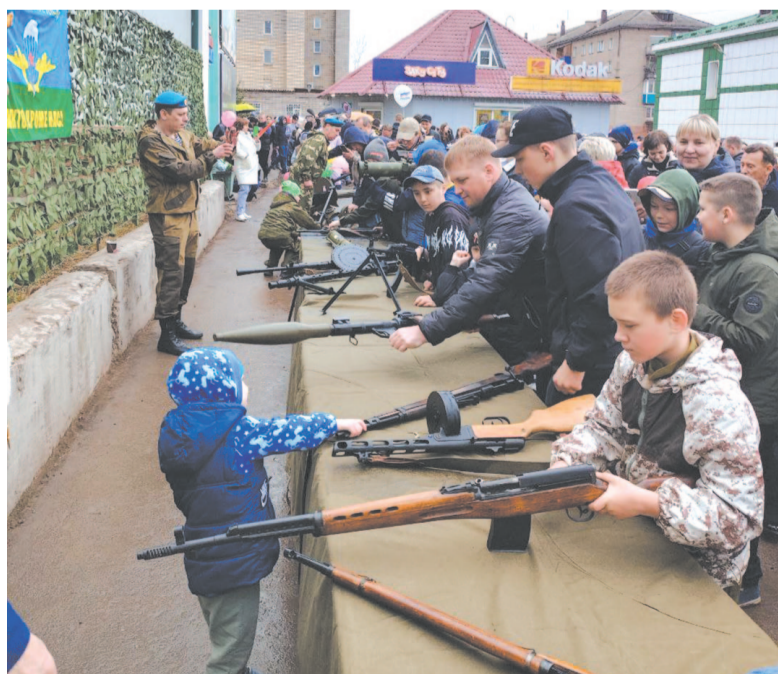
Выставка макетов оружия в День Победы.