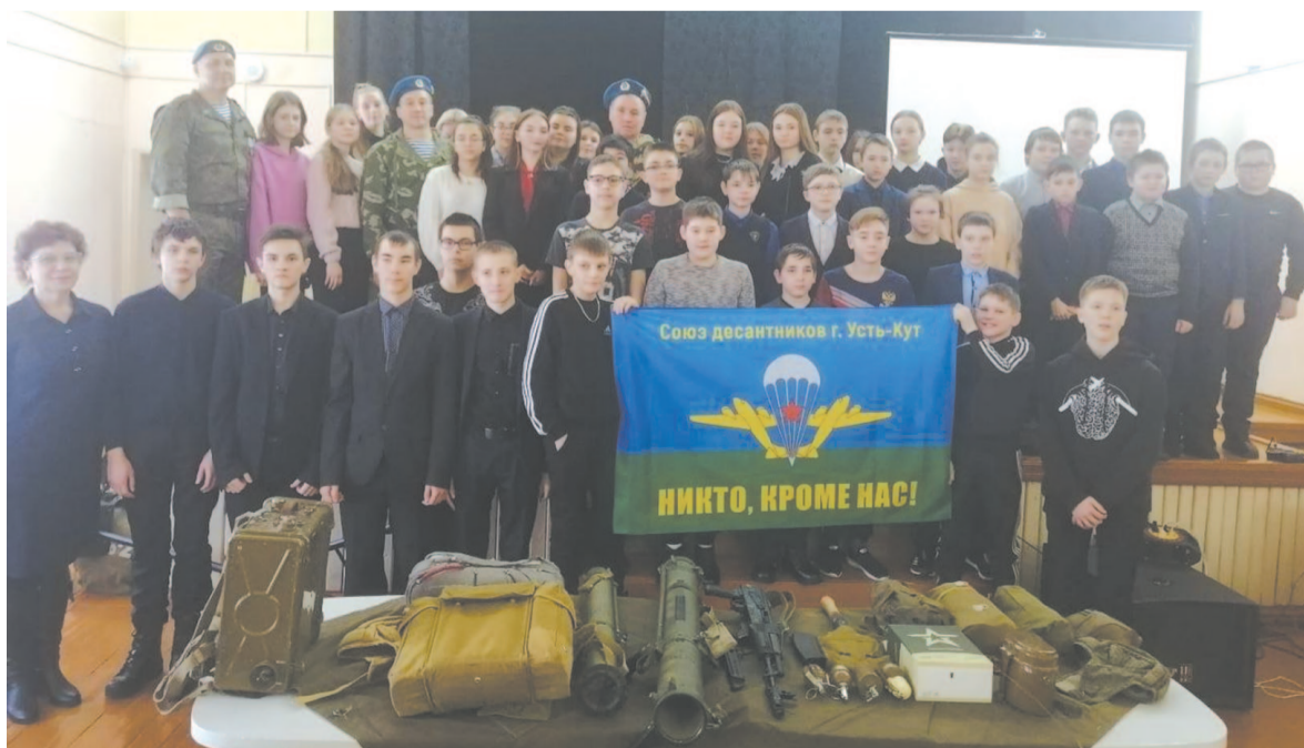
Выставка макетов оружия в Ручейском МО.