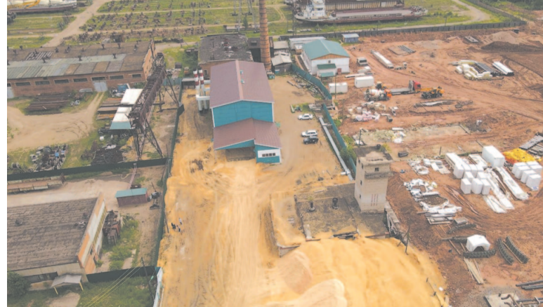
Котельная микрорайона РЭБ.