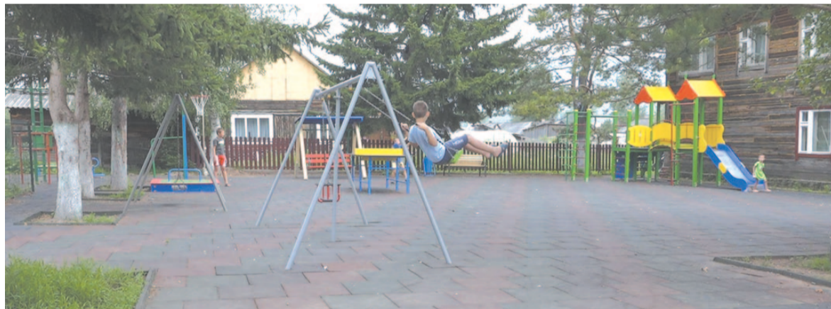
Детская площадка в посёлке Карпово

— Заявки от горожан для участия в конкурсном отборе принимаются до 20 августа. Каждый год мы можем реализовать по 15 подобных объектов на нашей территории, получив на реализацию проектов областные средства. Существуют и другие программы поддержки инициатив горожан, например для ТОСов. Чем больше мы будем участвовать в каких-то проектах, каких-то программах, тем больше средств будет привлечено на территорию. Благодаря этому появится больше новых благоустроенных пространств в городе, — подытожил Евгений Владимирович.