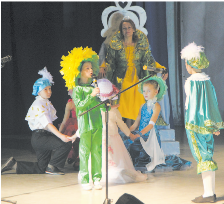
Выступление литературного клуба «Истоки вдохновения».

В последнее воскресенье ноября устькутяне отметили один из самых трогательных и теплых праздников – День матери. В КДЦ «Магистраль» 25 ноября состоялся концерт, посвященный этому событию, где каждый проникся волнительной атмосферой, увидел искренние улыбки и услышал приятные слова, адресованные всем мамам.