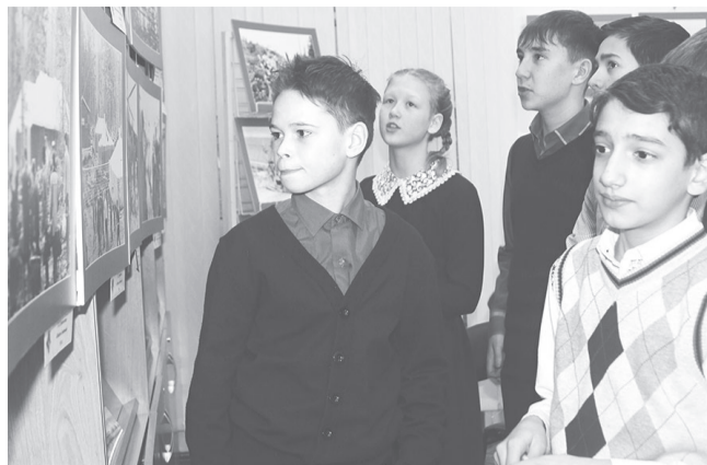
Выставку «Вечная молодость рельсовых строк» нескрываемым интересом разглядывали учащиеся школ.