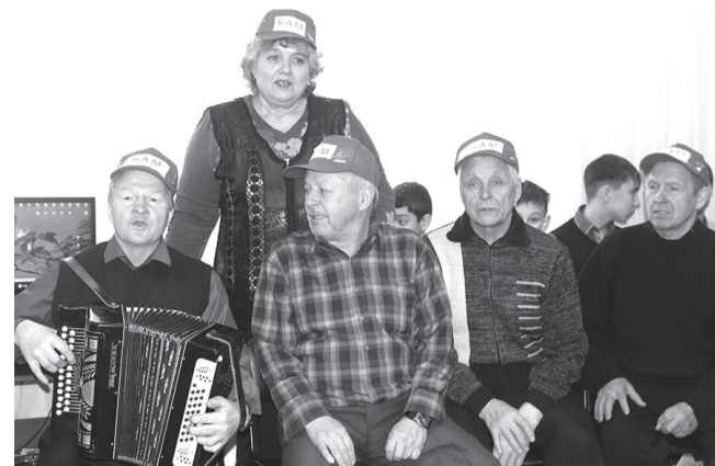
Неожиданным сюрпризом для всех стал концерт, устроенный ветеранами БАМа.