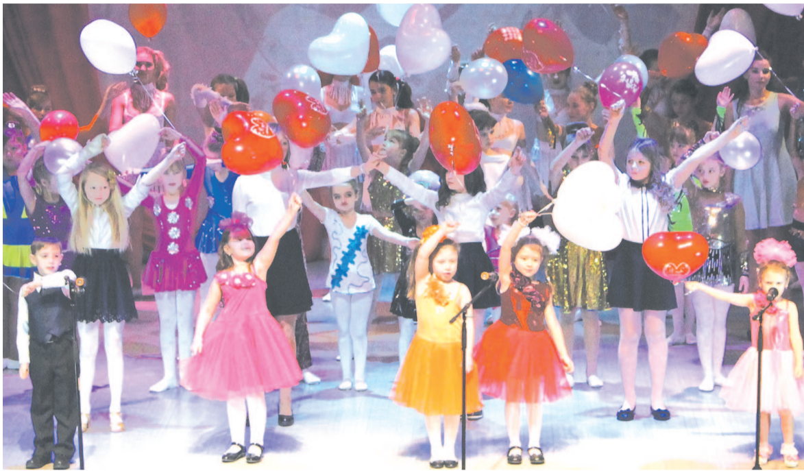
Концерт ко Дню Матери.

Как известно, «мамы всякие нужны, мамы всякие важны». Так, со сцены чествовали мам –