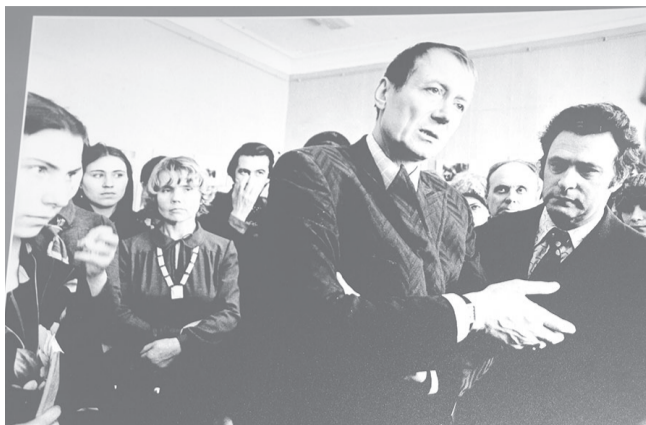
«Евгений Евтушенко на своей фотовыставке в Иркутском художественном музее».