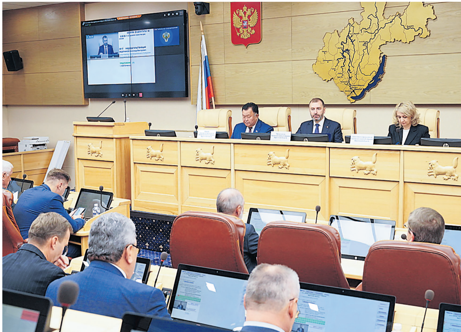
На 16-й сессии в областном парламенте обсудили более 30 вопросов.