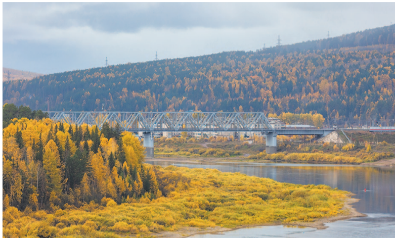
Настоящий туристический десант высадился в Усть-Куте 17 октября. Город посетили участники проекта «БАМ туристический», приуроченного к 50-летию Байкало-Амурской магистрали.

Гости не только ознакомились с местными достопримечательностями, но и оценили рекреационный потенциал территории. Чем может быть привлекателен Усть-Кут для желающих отдохнуть, читайте в нашем материале.