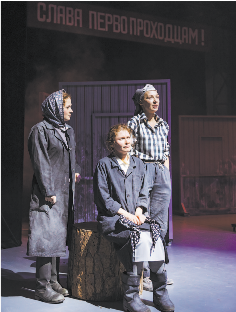
В Усть-Куте бамовцы и молодежь восхитились премьерой спектакля «Зинуля».

В Усть-Куте 16 и 17 октября состоялась премьера спектакля, посвященная 50-летию Байкало-Амурской магистрали. Зрители увидели историю простых людей, которая развернулась на фоне все-союзной грандиозной стройки. Им предстояло рассудить, кто прав: юная и чересчур преданная своим принципам Зинка Коптяева или водитель Петренко, которому нужно заботиться о своей семье.