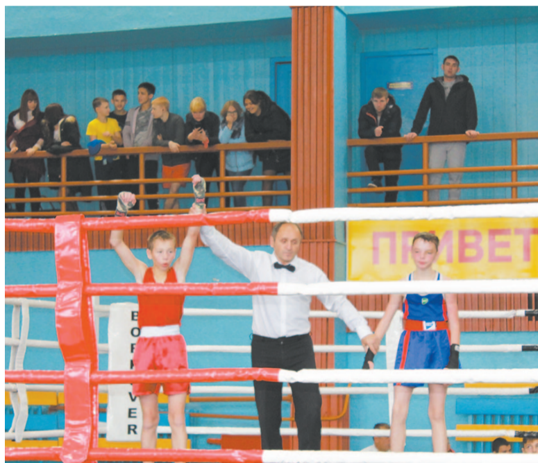
Первенство прошло зрелищно и масштабно, усть-кутские ребята выступили достойно