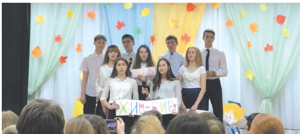
Старшекласники школы № 9 рассказывали о своих классах в песнях, танцах и сценках

26 октября в школе № 9 традиционно прошло посвящение в старшекласники. Новые ученики старшего звена продемонстрировали зрителям номера, где рассказали о своих классах.