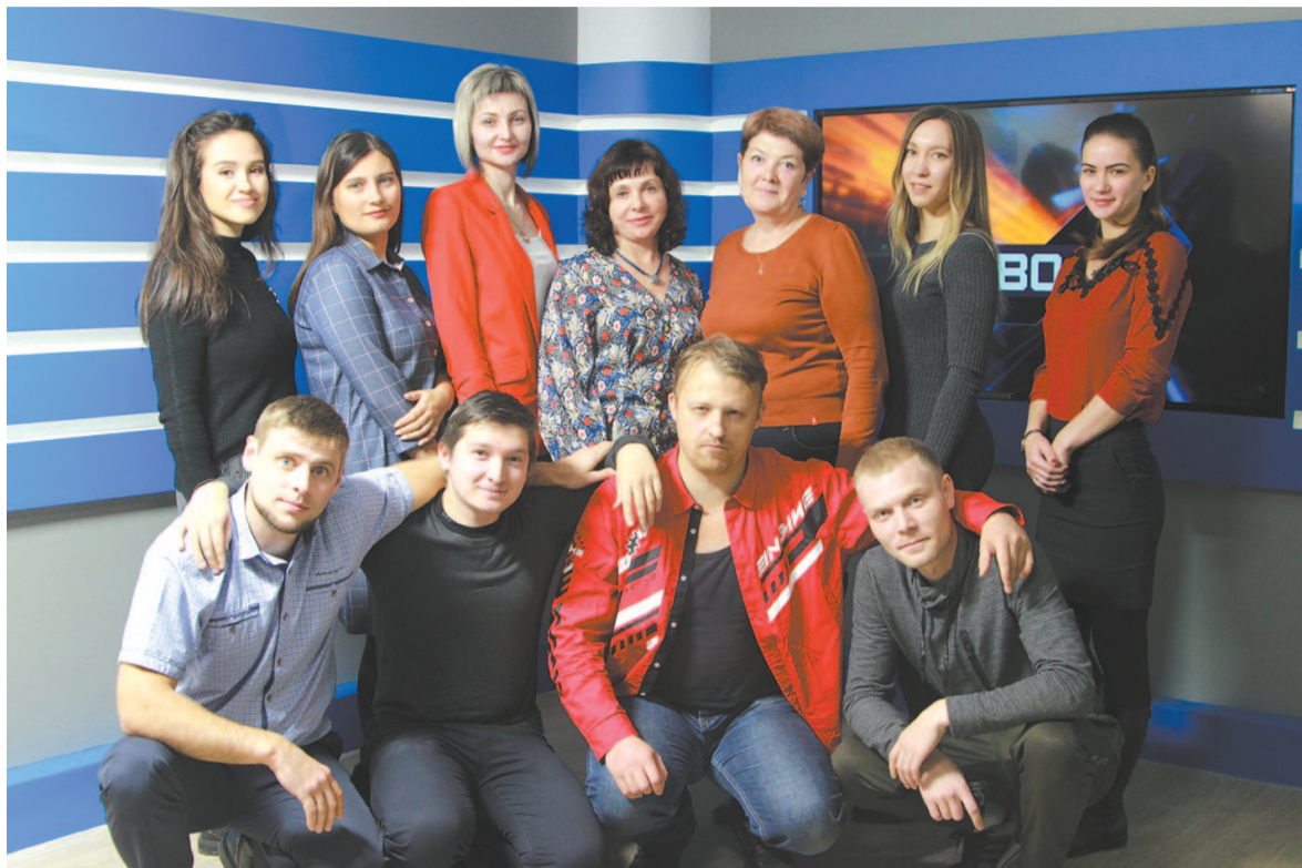
Дружный, креативный коллектив телеканала «Диалог»