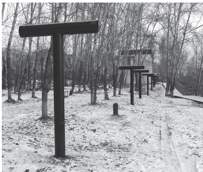
Строительство очередной теплотрассы на аллее в Речниках стало полной неожиданностью и вызвало недовольство устькутян