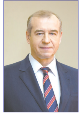
С.Г. Левченко, губернатор Иркутской области.

Желаю вам доброго здоровья, благополучия и успешной реализации всех намеченных планов во благо России!