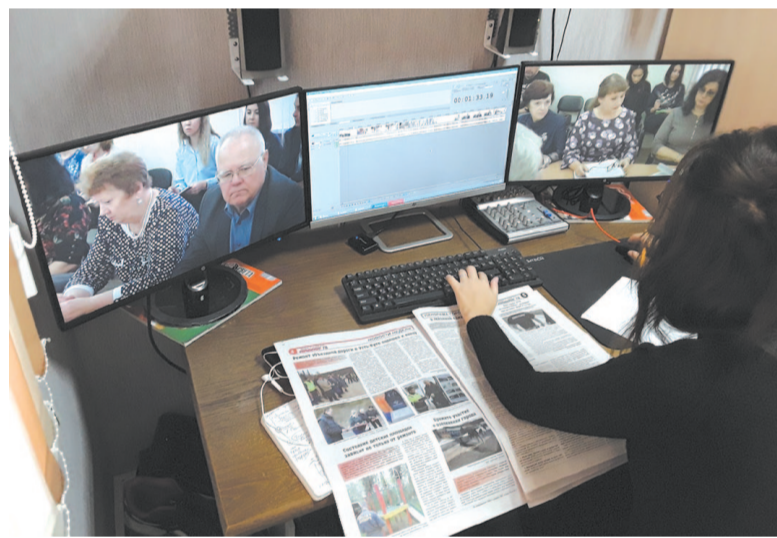
За два десятилетия сняты тысячи сюжетов о событиях, изменивших жизнь устькютян

Именно из «9 этажа» вышли все новые телевизионные проекты. Когда стало понятно, что не хватает времени, чтобы обо всем рассказать, вышла программа «Раньше всех». Позже захотели сделать новогоднее мероприятие, где можно было задействовать горожан и показать это в новогоднюю ночь. Тогда появился «Голубой огонек», в прошлом году его проводили уже в десятый раз. Несколько раз корреспонденты делали новогоднюю программу, которую снимали 31 декабря в прямом эфире. Журналисты на