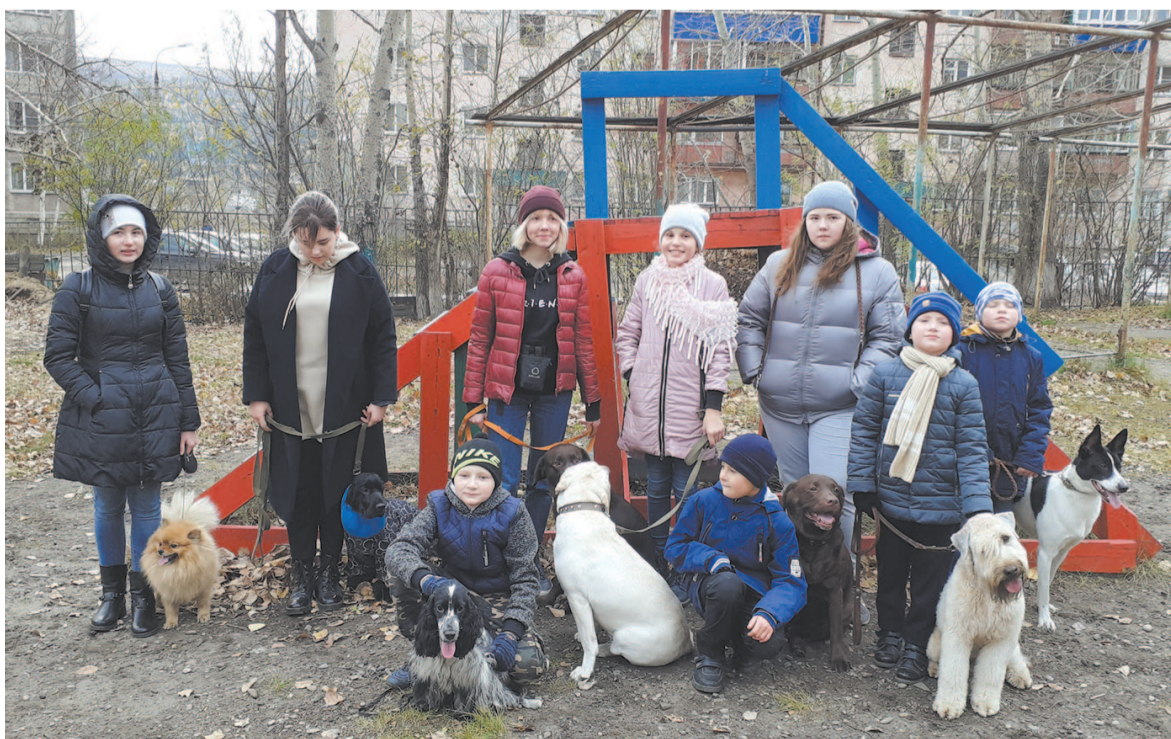
В объединении занимаются дети разных возрастов, они тренируют собак, воспитывают у них выдержку, учат выполнять разные команды

Елизавета Куленкова, фото из архива Инессы Максимовой.