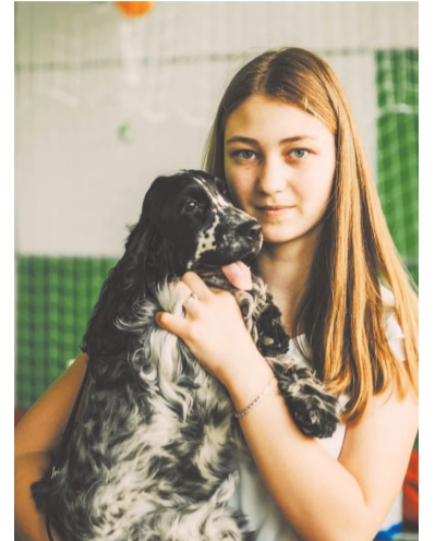
«Мой ласковый и нежный зверь»

Это удивительное место, где можно увидеть более 35 видов животных, представителей разных стран и материков. Среди них шиншиллы, хорьки, сахарные опоссумы, морские свинки, хомячки и мыши. Здесь есть австралийские нимфы, певчие красные розеллы, звонкие волнистые попугайчики, забавнейшие африканские попугаи-неразлучники. Также представлена интересная коллекция рептилий, амфибий, моллюсков и рыб.