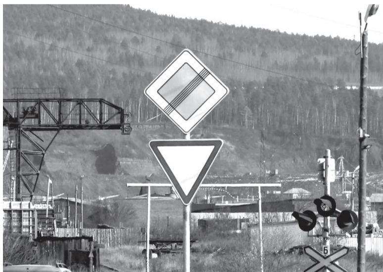
Дорожные знаки в Усть-Куте не всегда соответствуют правилам дорожного движения

Алена Белоусова, фото из интернет-источников.