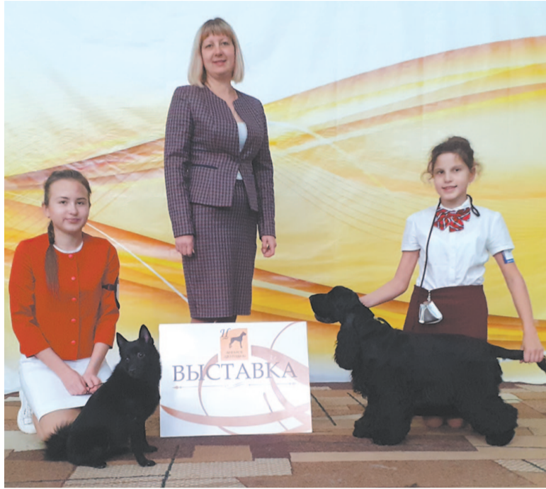
В клубе «Юный кинолог» числится порядка 20 собак, принимающих участие в различных выставках

В Москве в международном конкурсе «Зеркало природы» также