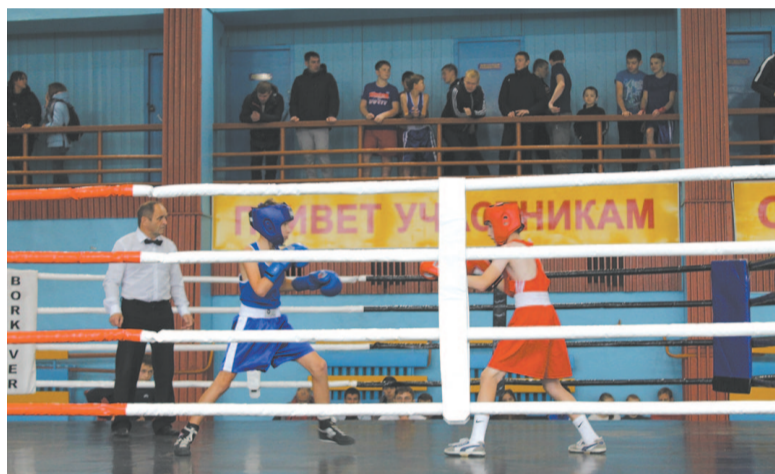
В соревнованиях участвовало 120 боксёров из 11 команд Иркутской области, а также спортсмены из Новосибирской области и Республики Узбекистан