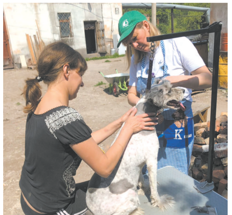
Ребята занимаются не только своими питомцами, но и помогают пункту временной передержки безнадзорных животных