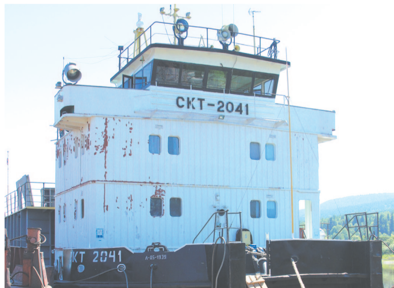
Судно не простаивает, только пришли в порт и снова под погрузку.