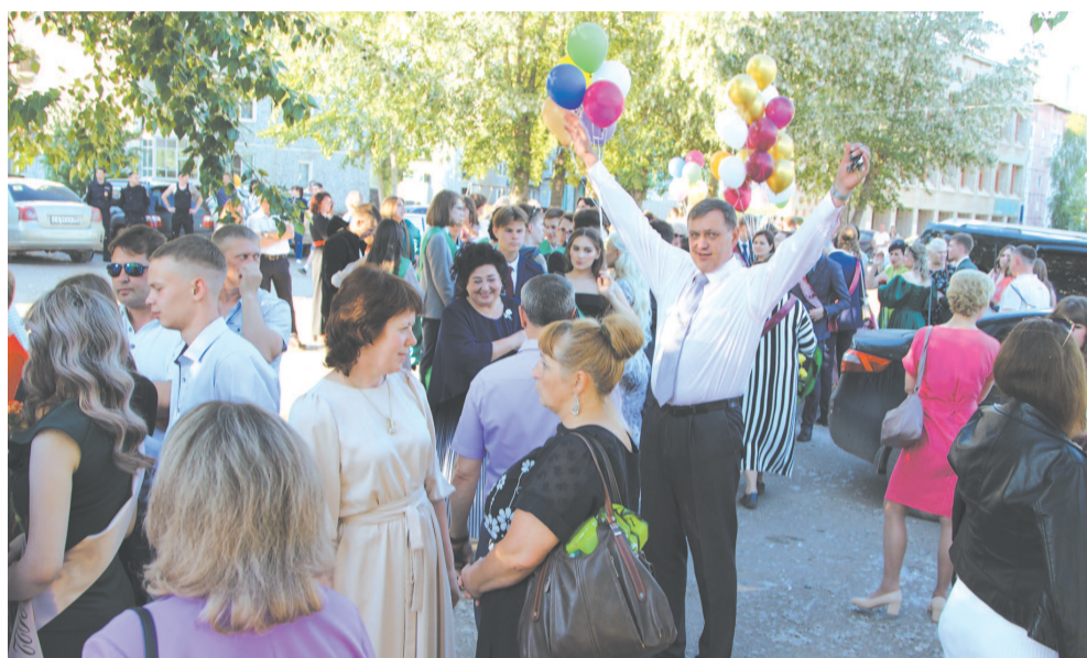
Родители и учителя радуются за выпускников.