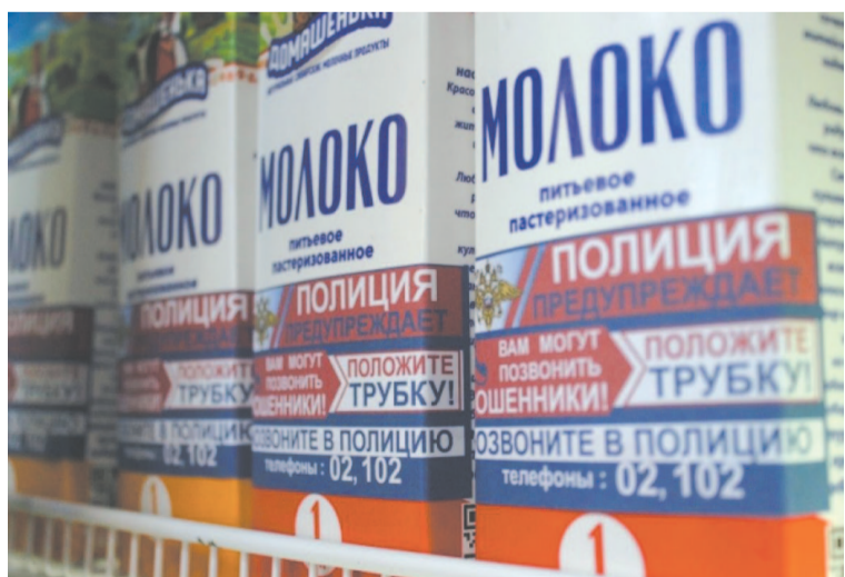
На тетрапаках с молоком точно прочитают важные предупреждения.

«Полиция предупреждает: вам могут звонить мошенники! Положите трубку! Позвоните в полицию!» - рекомендуют наклейки. Также на них указаны телефоны правоохранительных органов. Таким образом МВД надеется привлечь к проблеме телефонного мошенничества внимание граждан, особенно пожилых людей, которые часто становятся жертвами злоумышленников.