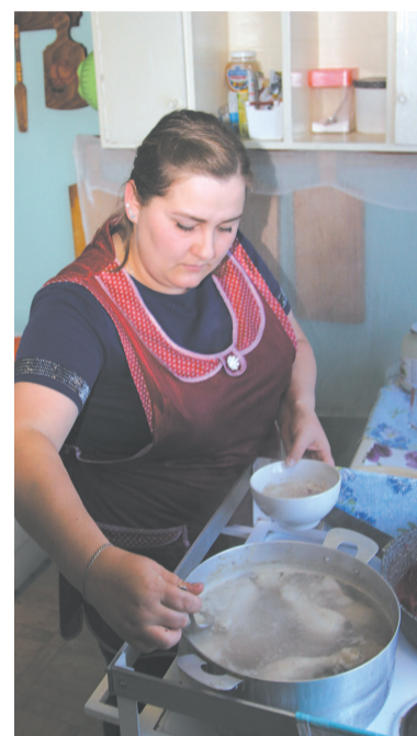
Роль повара на судне трудно переоценить.