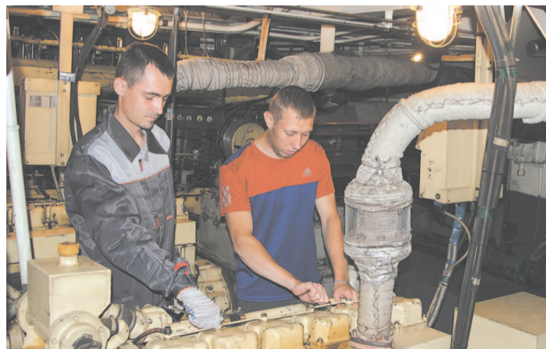
Помощники капитана контролируют работу всех судовых агрегатов.