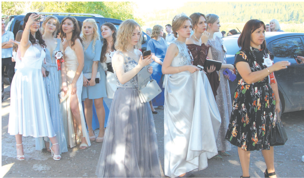
Выпускной вечер – праздник красоты.

Прозвучало много тёплых напутственных слов, и теперь вчерашние подростки вступают во взрослую жизнь.