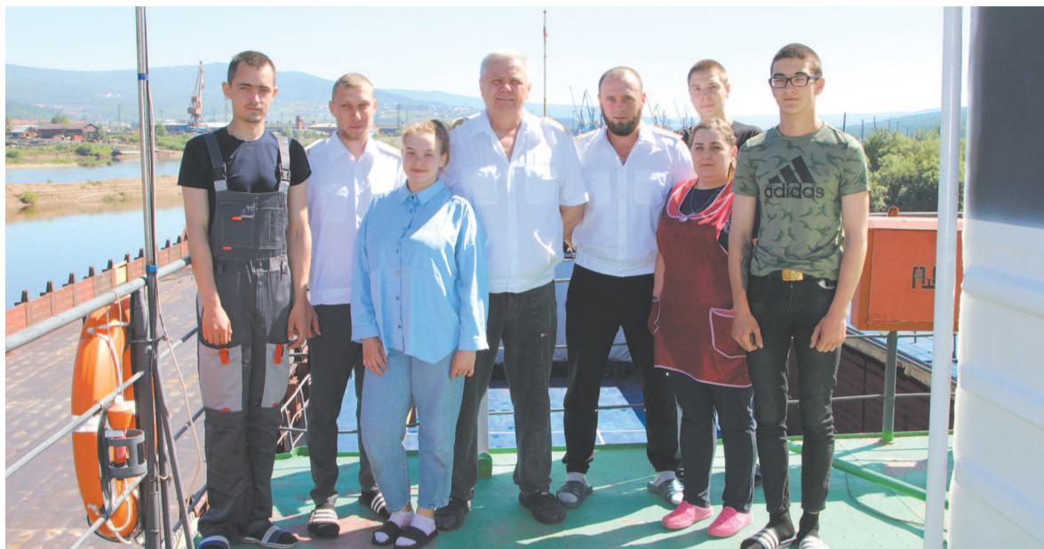
Экипаж на мостике собирается нечасто.