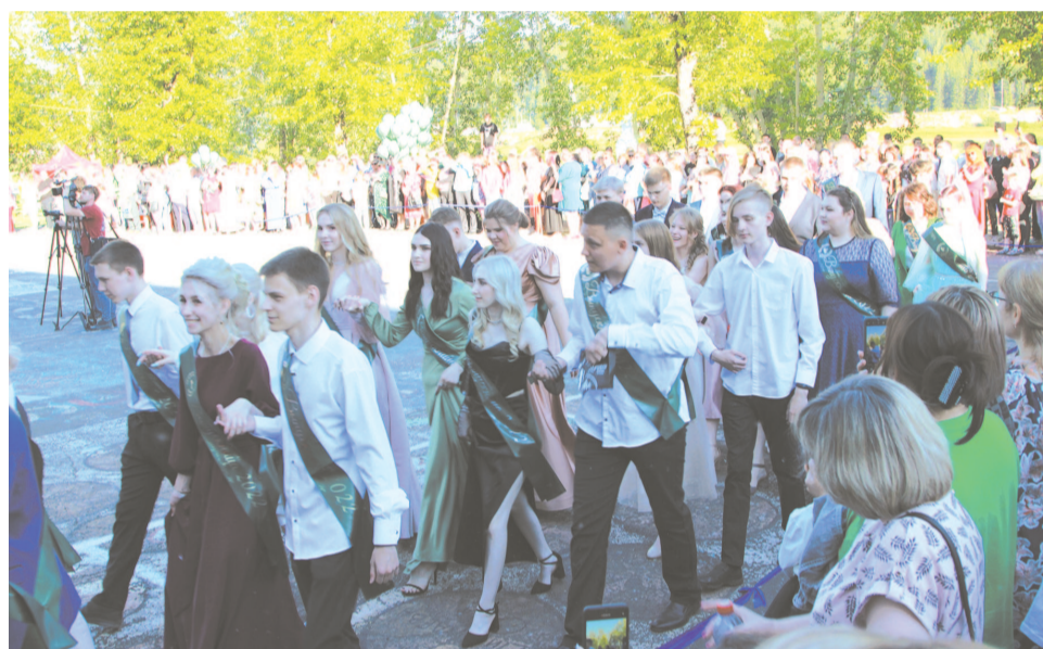
По традиции школы и лицей выходят на площадь колоннами.