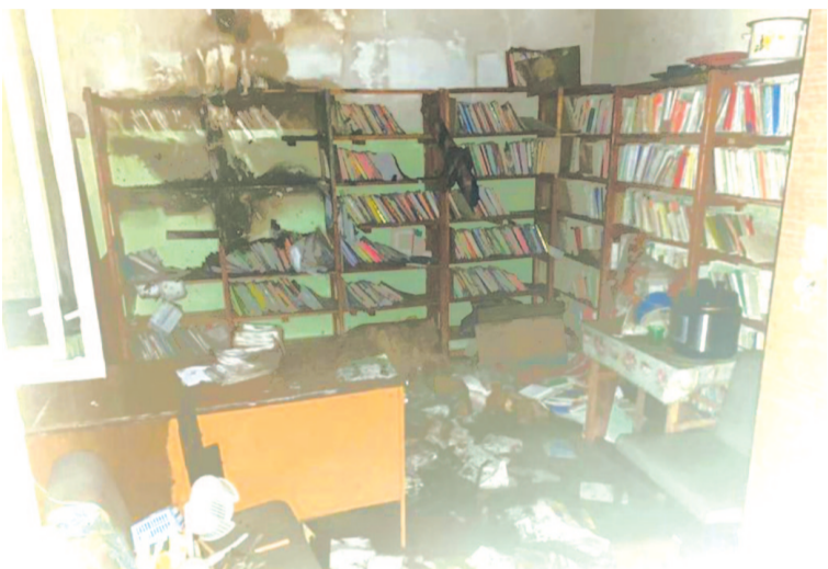
Огонь уничтожил десятки папок с документами.

Пожар произошёл в ночь на 27 июня. В кабинете на третьем этаже горели документы. Огнём охватило площадь в три квадратных метра. Как сообщает пресс-служба ГУ МЧС России по Иркутской области, пожарные быстро ликвидировали возгорание, пострадавших нет. Дознаватели МЧС России установили, что скорее всего причиной ЧП стало короткое замыкание электропроводки.