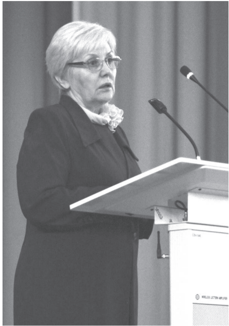
Общественный уполномоченный по правам ребёнка Т.Б. Кулакова.