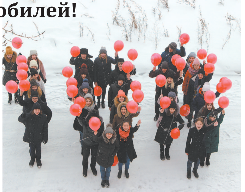
Флешмоб от учащихся школы № 4