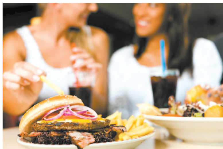
Не стоит злоупотреблять жирным и мучным

ция местного молокозавода, фирмы «Янта», «Простоквашино». Кроме того, нынче на рынке много генетически модифицированных продуктов. Товары, поступающие в магазины нашего города, раз в квартал исследуют на наличие ГМО, и пока таких добавок не обнаружили. Кроме того, изучают мясо птицы на содержание антибиотиков и патогенных микроорганизмов, и подобного тоже ещё не встречалось. – Зато есть такая проблема: нам, жителям северных территорий, остро не хватает йода, – рассказывает начальник ТО Управления Роспотребнадзора. – Раньше хлеб и молочные продукты, произведенные в нашем районе, обогащали этим элементом, а сейчас остается только йодированная соль. И то нужно всегда смотреть дату выпуска: спустя полгода она перестает быть полезной. Важно самим соблюдать культуру питания. Из-за быстрого темпа жизни горожане привыкли обходиться без завтрака, перекусывать на работе шоколадками и пирожками, а вечером наверстывать весь дневной рацион. Причем калории компенсируются «ударным» углеводным меню: