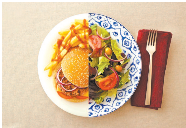
Меню должно быть сбалансированным