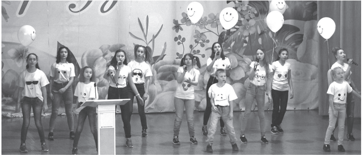
Музыкальный сюрприз участникам форума подготовила вокальная группа «Микс» Центра помощи семье и детям, оставшимся без попечения родителей.