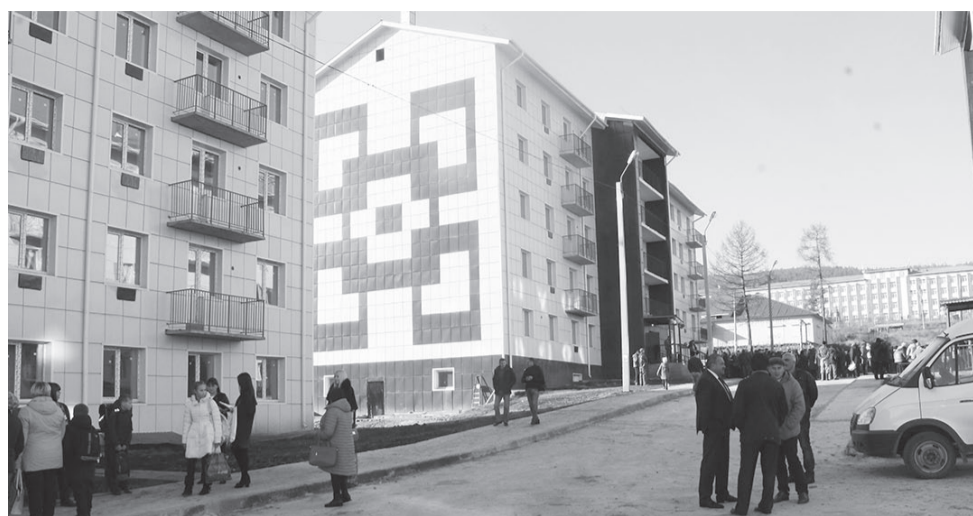
Заселение новых домов по улице Халтурина по программе переселения граждан из аварийного жилья.

В сфере ЖКХ работают 24 предприятия и организаций, в том числе шесть управляющих компаний, пять ТСЖ, одиннадцать ООО,