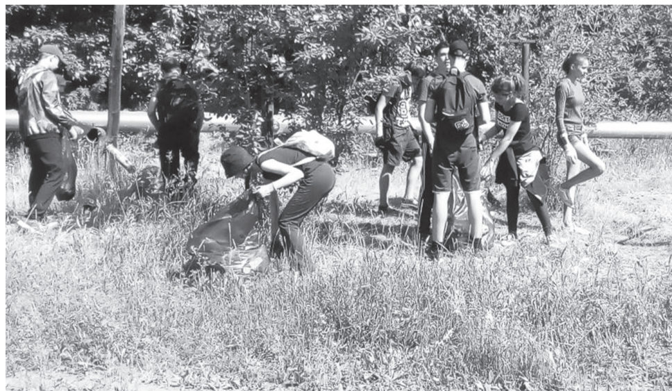
Работа трудового отряда молодежи в рамках проекта «Мы за чистый город».

2018 год был объявлен Годом экологии. Поэтому приоритетным направлением деятельности отдела по молодежной политике, спорту и культуре являлось активное вовлечение общественных организаций, представителей инициативной молодежи, волонтеров в социально-экономическое, общественно-политическое и творческое развитие нашего города. Основным движущим фактором этого направления – муниципальная программа «Молодежная политика. Приоритеты, перспективы развития на 2017 – 2019 годы». Хотелось выделить конкурс