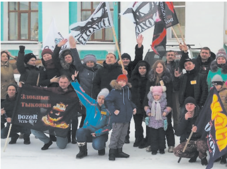
Активисты клуба собрались около здания водного вокзала