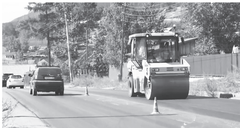
На ремонт дорог Усть-Кута направлено 59,46 млн руб.