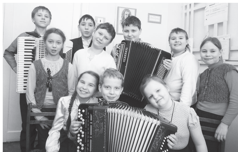
Народное отделение в ДШИ появилось одним из первых

Искусство не знает ни границ, ни возрастных различий. В нашей школе с удовольствием обучаются