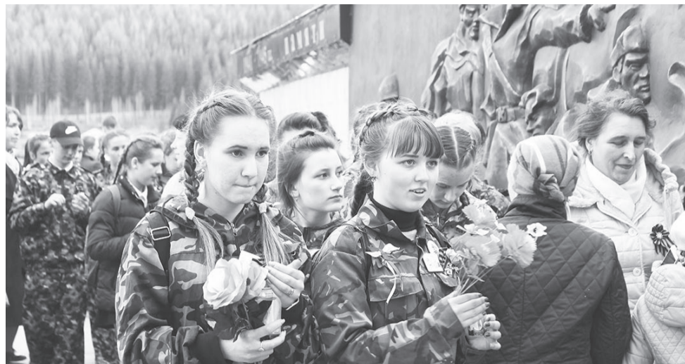
Военно-патриотическое воспитание – одно из приоритетных направлений молодежной политики

грантов на организацию летнего отдыха и трудовой занятости молодежи и детей, по его результатам 300 тыс. рублей были распределены между победителями для реализации проектов по организации летних профильных лагерей и трудовых бригад. Озеленение городских территорий, организация летнего военно-патриотического лагеря и сиреневой аллеи были проведены при достойной финансовой поддержке и благодаря педагогам и воспитанникам Центра дополнительного образования, МОУ Лицей и МОУ СОШ № 2. В результате победы на конкурсе проектов «Мы за чистый город» общественной организации «Детский экологический клуб «Росинка» ежегодно работает летний трудовой отряд молодежи.