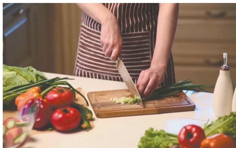
Отдавайте предпочтение свежим фруктам и овощам