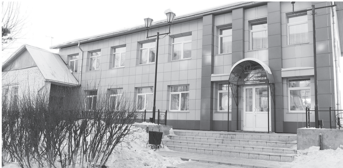
Детская школа искусств всегда богата талантами