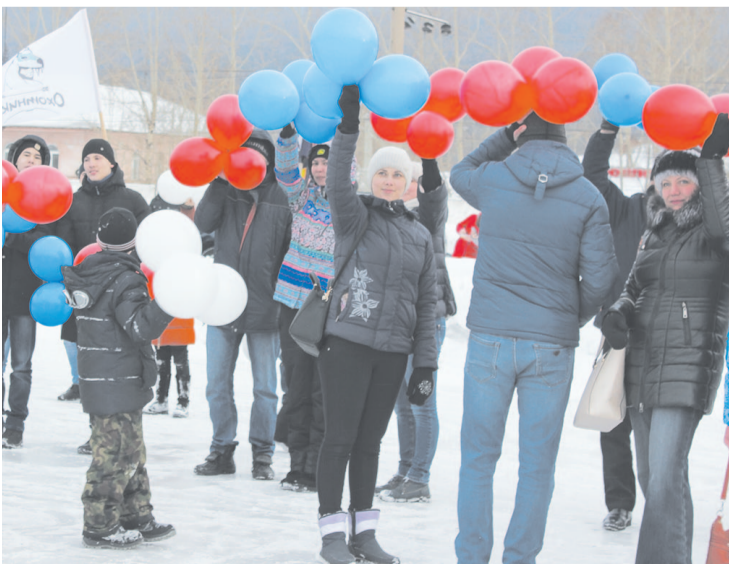
Устькутяне с большим удовольствием поучаствовали во флешмобе

Ольга Фофонова, фото автора и из архива клуба «DozoR».