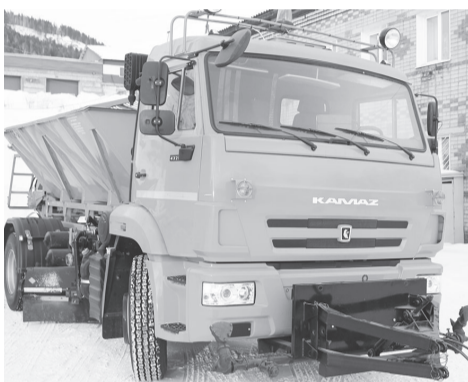
Администрацией приобретена новая снегоборочная техника

Размещено 62 муниципальных заказа на ремонтные работы объектов ЖКХ, автомобильных дорог, приобретение квартир на вторичном рынке жилья путем проведения аукционов и котировок. По их результатам с победителями аукционов заключено 62 муниципальных контракта на общую сумму 142,07 млн руб. Экономия муниципальных средств после проведения аукционов составила 10,01 млн руб.