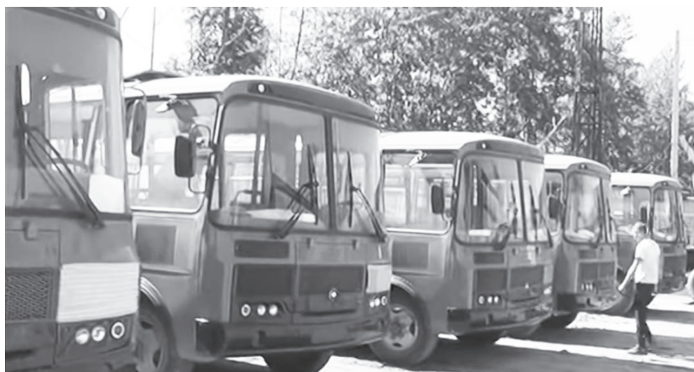
Администрацией приобретены автобусы в рамках программы «Народные инициативы»