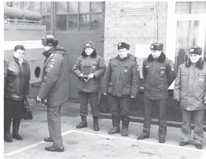
Огнеборцы Усть-Кута передали технику добровольным пожарным дружинам

В Подымахино и Верхнемарково появились собственные пожарные машины. Поскольку поселки находятся далеко от города (Подымахино в 60 километрах, Верхнемарково – в 150), в случае пожара первый удар принимают на себя добровольные дружины. Именно они не дают огню распространиться, пока на помощь спешат пожарные подразделения из города.