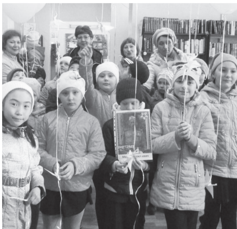
Участники акции «Белый журавлик»

На базе библиотеки действуют четыре клуба по интересам: для детей – «Затейник» и «Жар-птица», последний отметил свое 10-летие в 2016 году, для людей пожилого возраста – «Сударушка» и «Анютини глазки». Также в тесном сотрудни-