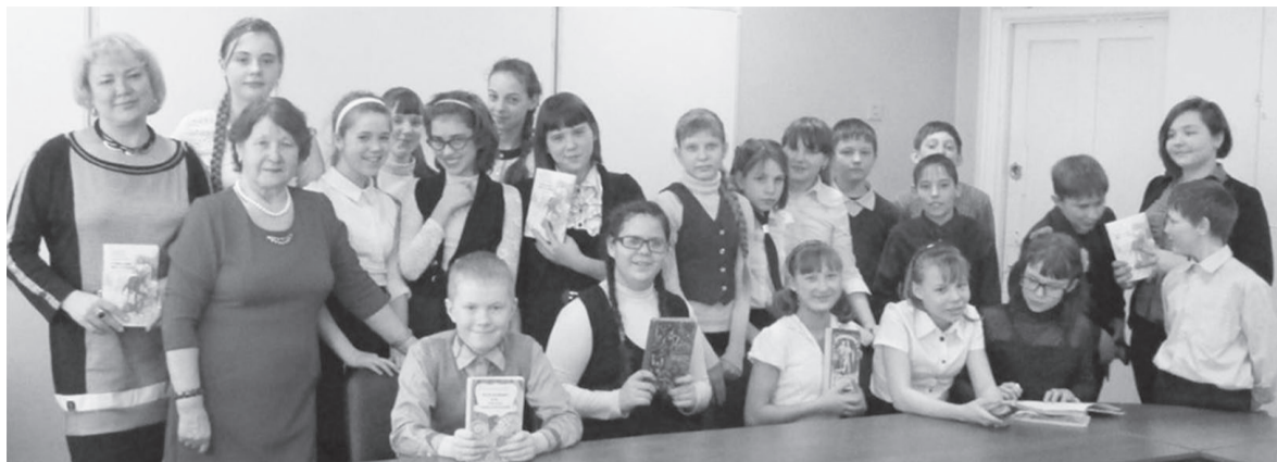
Литературная гостиная «Я всегда буду писать для детей» по творчеству Геннадия Михасенко